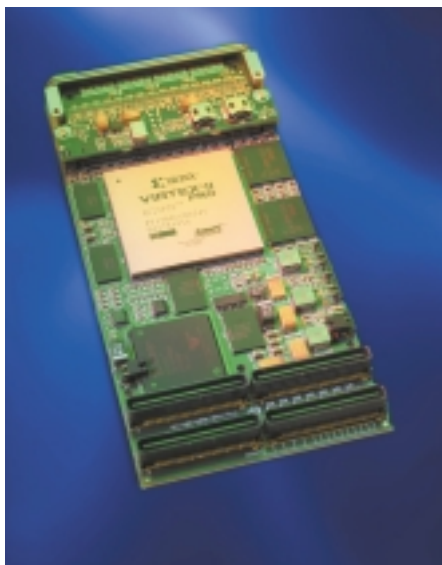
Cette carte mezzanine au format PMC (elle peut se monter sur des cartes PCI, CompactPCI et VME) fait office de carte coprocesseur. Le cœur est constitué par un FPGA Virtex II de Xilinx. Elle comporte jusqu'à 16 Mo de SDRAM, 256 Mo de SDRAM et 32 Mo de flash.

L'architecture de base des FPGA actuels se compose d'un réseau d'éléments logiques de base, complété par un réseau maillé d'interconnexions programmables, avec un grand nombre d'entrées/sorties (plus de 1 000 broches sur certains modèles). La sélection des fonctions logiques, la configuration des interconnexions et la définition des entrées/sorties sont réalisées en téléchargeant un fichier binaire de configuration à l'intérieur du FPGA. Sur certains FPGA, le fichier de configuration est stocké dans une mémoire non-volatile et il est ainsi conservé lorsque le système n'est pas sous tension. Sur d'autres, la configuration est stockée dans la mémoire volatile, et le circuit doit donc être réinitialiser à chaque mise sous tension. Chaque élément logique se compose typiquement d'une table de vérité qui implémente des fonctions logiques, d'un registre, et d'une logique dédiée pour permettre de réaliser les opérateurs arithmétiques comme par exemple des additionneurs. Les registres sont cadencés par des horloges qui se "propagent" dans le FPGA avec de très faibles variations temporelles.