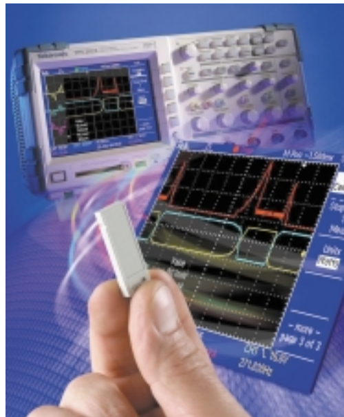
Le logiciel intégré d'exploitation de données permet de réduire le temps de développement et de test, grâce à une large variété de mesures préenregistrées.

Au niveau des laboratoires d'étude, l'outil de référence est l'oscilloscope, même lorsqu'il s'agit de faire des mesures sur des équipements de puissance. La plupart des appareils électroniques ont une masse "châssis", à laquelle sont connectés les différents circuits. On dit alors que les signaux sont référencés à la masse, celle-ci étant arbitrairement fixée à zéro volt. La masse "châssis" est reliée à celle du secteur. La grande majorité des oscilloscopes fonc-