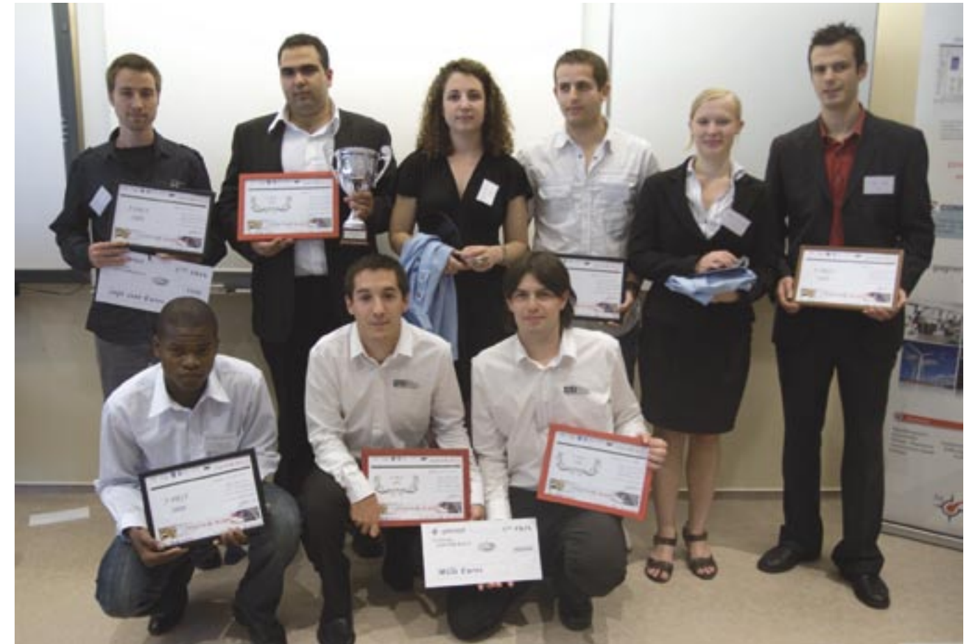
La majorité des participants a accepté de travailler sur le Challenge ControlBuild en parallèle de leur cursus scolaire. Le jury en a tenu compte lors de ses délibérations, et les efforts fournis par ces étudiants se sont révélés payants pour ceux d'entre eux qui repartent de la finale avec des propositions de stages.

était modélisé ou presque : les capteurs et actionneurs, la partie alimentation et distribution électrique, et même les Interfaces homme-machine (IHM). Ne restait plus aux étudiants qu'à programmer les automates pour réaliser le convoyage des palettes et l'assemblage des pièces (en l'occurrence des empilements de pièces issues de magasins différents), selon une séquence définie.