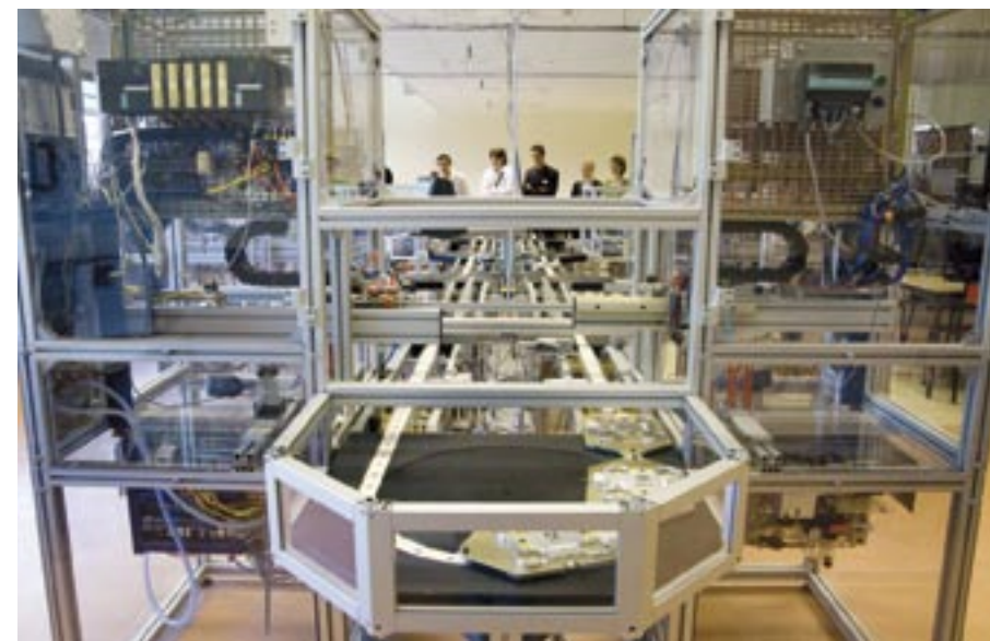
Les participants ont réalisé le contrôle-commande de ce système flexible de production, un outil pédagogique de l'AIP Lorraine.

Au démarrage du Challenge, les organisateurs ont remis aux participants des licences ControlBuild et les fichiers correspondants au système flexible de production. Tout y