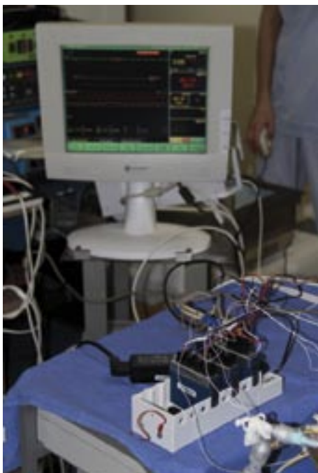
Le prix "Toutes catégories confondues" est revenu à une application d'élaboration d'une technique innovante de protection du poumon au cours d'opérations de chirurgie cardiaque.

En plus de ces cinq lauréats, le jury a désigné un vainqueur "Toutes catégories confondues", qui, outre les lots précédents, a gagné un kit complet pour participer à NIWeek 2010 (billets d'avion, hébergement et invitation à l'événement). Cette manifestation annuelle est le pendant américain de NIDays. Elle a lieu en août à Austin, Texas, où est basée la maison mère de NI. Et