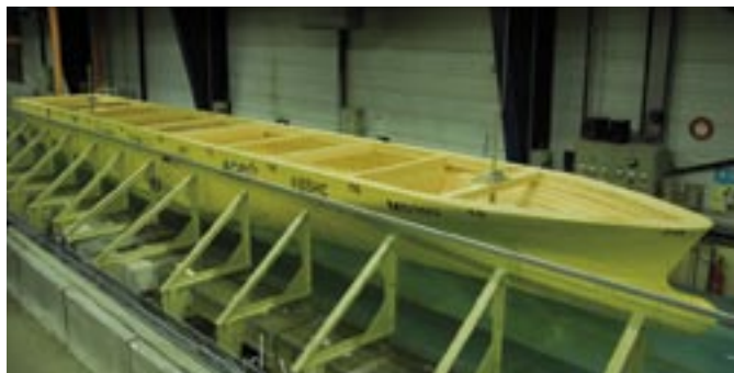
Lauréat dans la catégorie "Acquisition de données" : le développement d'une application pour la validation des systèmes hydrauliques des futures écluses du canal de Panama.

Lauréat dans la catégorie "Automatisation industrielle" Mathieu Steiner et Salissou Issa d'Arcale pour l'industrialisation